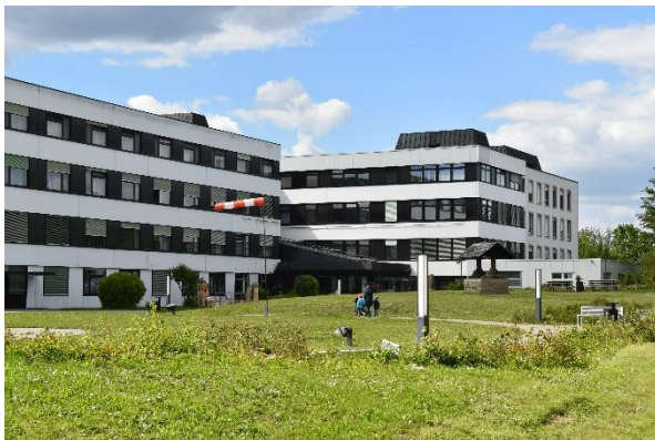
Hohenloher Krankenhaus in Öhringen